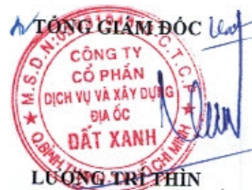
LUÔNG TRỊ THÌN